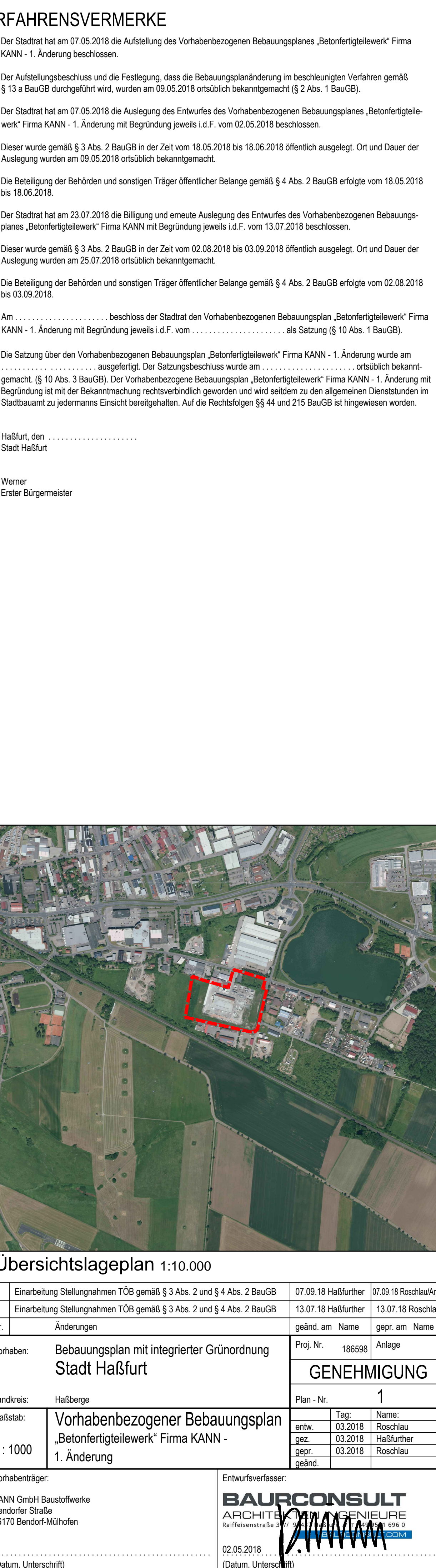
1. Änderung Vorhaben- und Erschliessungsplan

Übersichtslageplan 1:10.000 2 Einberufung Stellungnahmen TOB gemäß § 3 Abs. 2 und § 4 Abs. 2 BauGB 07.09.18 Haßfurt 07.09.18 Roschtau/Ansitz 1 Einberufung Stellungnahmen TOB gemäß § 3 Abs. 2 und § 4 Abs. 2 BauGB 13.07.18 Haßfurt 13.07.18 Roschtau Nr. Änderungen geänd. am Name gepr. am Name Vorhaben: Bebauungsplan mit integrierter Grundordnung Stadt Haßfurt Projekt-Nr.: 195598 Anlage: GENEHMIGUNG Plan-Nr.: 1 Landkreis: Haßberge Mafstab: Vorhabenbezogener Bebauungsplan „Betonfertiglewerk“ Firma KANN - 1. Änderung 1:1000 Vorhabenverfasser: KANN GmbH Bauhofwerke Bendorfer Straße 96170 Bendorf-Mühlheim Entwurfsverfasser: BAURCONSULT ARCHITECTUR GENIEßERE Haßfurterstraße 116 96108 Haßfurt Tag: 03.2018 Name: Roschtau gepr.: 03.2018 Name: Roschtau geänd.: Datum: 02.05.2018 Datum: 02.05.2018