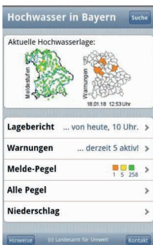
Bild 1: Das Online-Angebot https://m.hnd.bayern.de/ bietet alle Hochwasserwarnungen auf einen Blick.

Im Hochwasserfall geben die Lageberichte mehrmals täglich einen Überblick zur Hochwassersituation und eine Vorschau auf die weitere Entwicklung. In den Warnungen beschreiben die Wasserwirtschaftsämter detailliert nach Landkreisen die Hochwasser-Situation. Jeder kann darüber hinaus unter www.hnd.bayern.de die Wasserstände an den Pegel-Messstationen in seiner Nähe verfolgen.